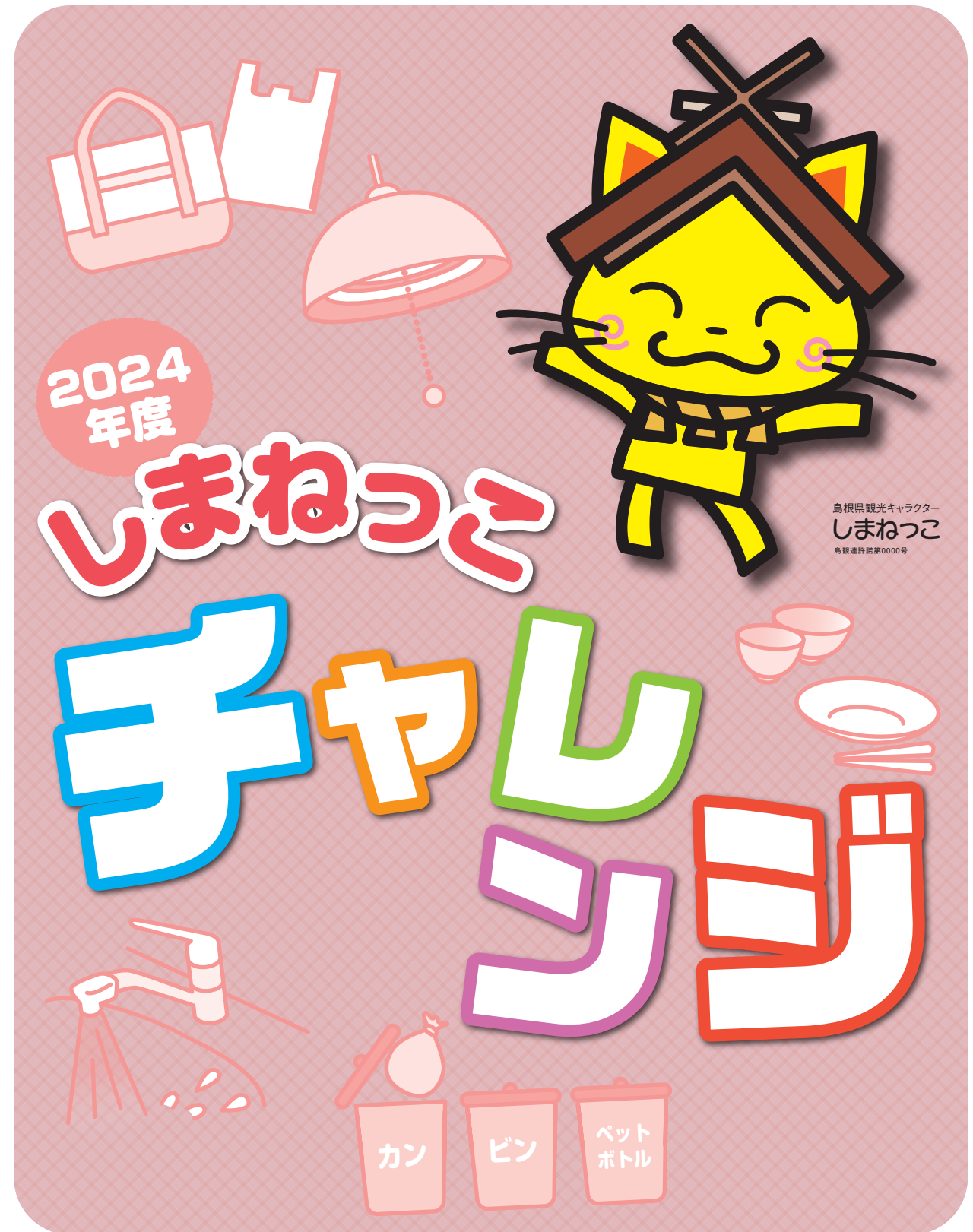
島根県観光キャラクター しまねっこ 鳥獣通許証第0000号

島根県地球温暖化防止活動推進センター / (公財)しまね自然と環境財団松江事務所